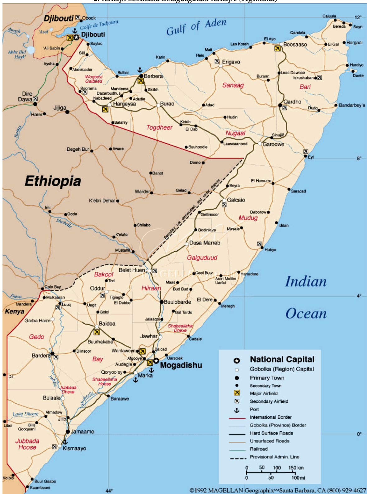
2. térkép: Szomália közigazgatási térképe (régiókkal)