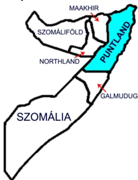
1. térkép: Szomália „kvázi-önálló” területei